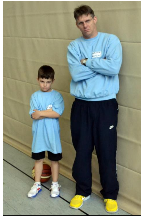
Neulich an der Offense-Station...