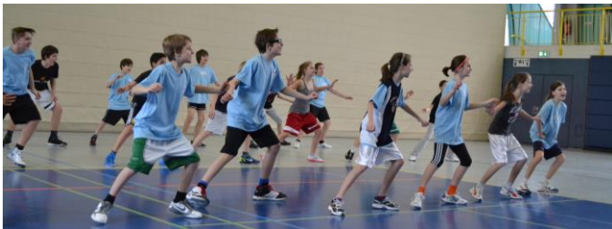
Defense macht Spaß ☺

Woran merkst du dass das Camp dich stresst? – Du schreibst deinen Namen auf die Bretzel und beißt in die Wasserflasche!